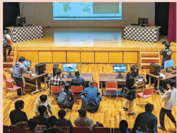
eスポーツ大会の様子